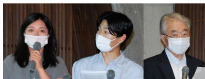
王氏 中村氏 金田氏