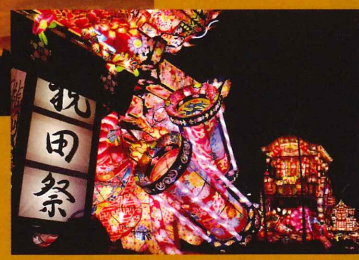
第18回 優秀作品「美しすぎる行燈山車(砺波市出町)」