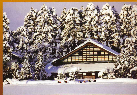
第18回 佳作「トカ雪の朝(砺波市太田)」