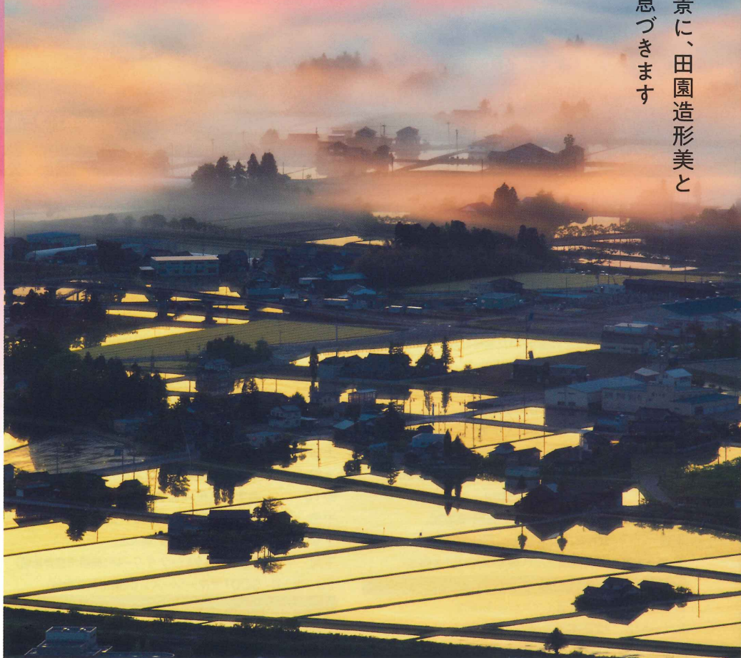
散居村大賞「夢幻の朝」