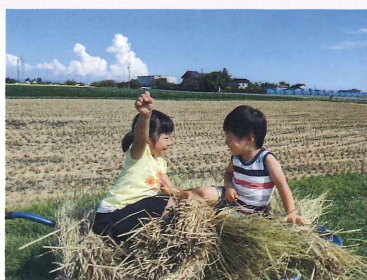
となみ野歳時記賞「お米いっぱい食べるぞ」